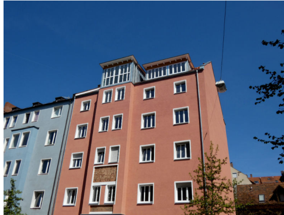
Sonnige ruhige Lage