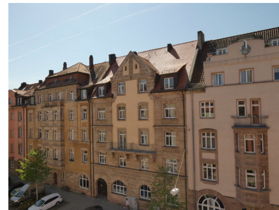
Blick aus dem Wohnzimmer