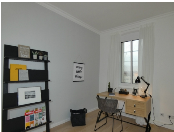
Schlafzimmer oder Büro